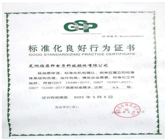
“AA级标准化良好行为”单位