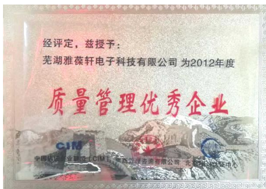
质量管理优秀企业