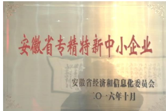
安徽省专精特新中小企业证书